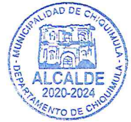
Rolando Arturo Aquino Guerra ALCALDE MUNICIPAL