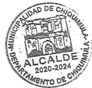
Rolando Arturo Aquino Guerra ALCALDE MUNICIPAL