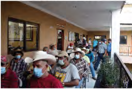
DIA DEL PADRE