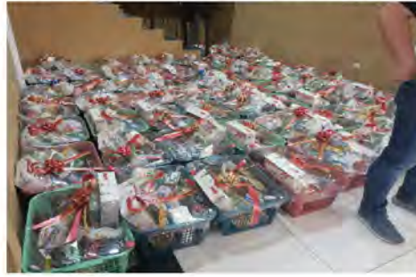
ENTREGA DE CANASTA NAVIDEÑA