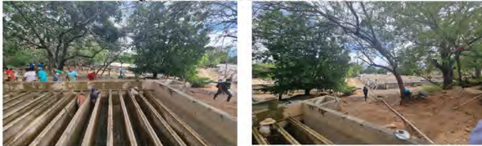
TANQUES DE AGUA EN BARRIO ZONA 4