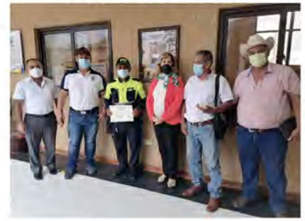
SUPERVISIÓN DE RECURSOS HUMANOS EN EJECUCIÓN DE PROYECTOS