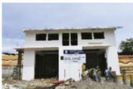
BODEGA PARA BASURA