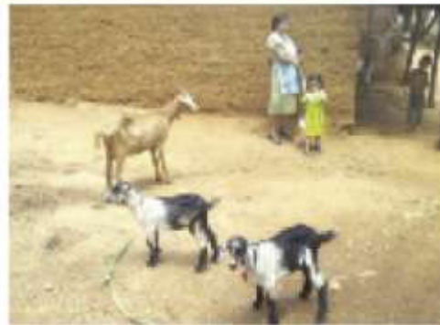
Establecimiento de 25 huertos familiares en la Aldea Maraxcó.