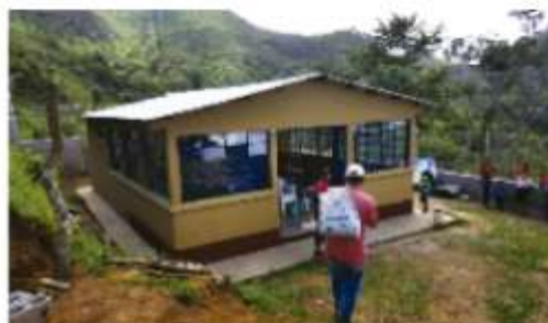
CENTRO DE CONVERGENCIA ALDEA EL SAUCE